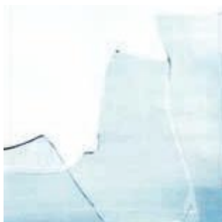
Rotura del vidrio común

El vidrio común, sólo para ciertas aplicaciones y tamaños, es seguro. Cuando éste se rompe, se fragmenta en trozos puntiagudos con bordes filosos. Si la rotura es por impacto humano puede producir consecuencias no deseadas para las personas.